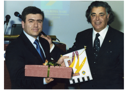
25 Gennaio 2002 - Conviviale "Nuovi scenari della comunicazione Internet"