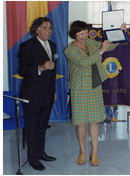
Premiazione docenti di istituto