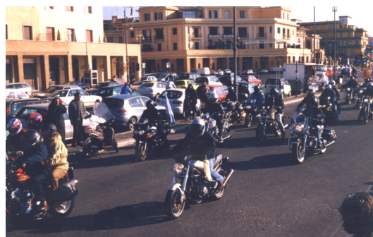
9 Dicembre 2001 2° Moto Nobile Raduno In ricordo delle vittime degli incidenti stradali