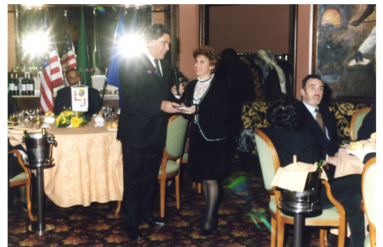
Novembre 2001 Maratona nazionale di matematica