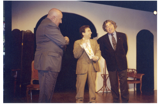
19 Ottobre 2001 Serata Sociale a teatro Teatro dei Cocci - Roma