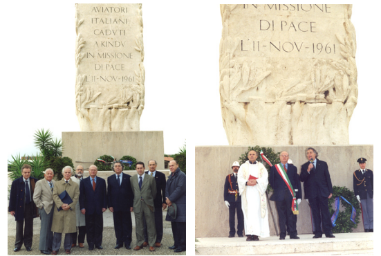
11 Novembre 2001 Cerimonia in ricordo dei caduti di Kindu