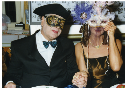
12 Febbraio 2002 - Festa di Carnevale