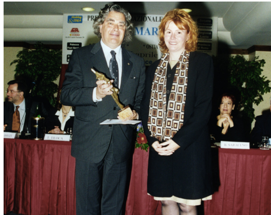
27 Aprile 2002 Premio internazionale di poesia "Ostia nel mondo"