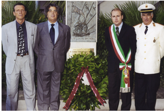
29 Settembre 2001 Commissariato di Ostia - Commemorazione ai caduti delle forze dell'ordine