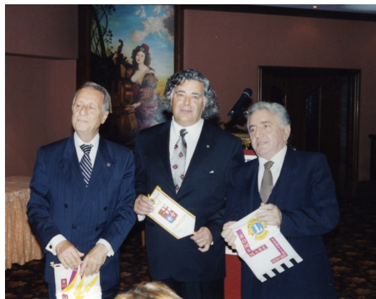
27 Maggio 2002 Charter Night Presidente L.C. Tirrenum (DX) e socio Colloca (DX)