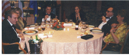
29 Dicembre 2001 - Festa degli Auguri