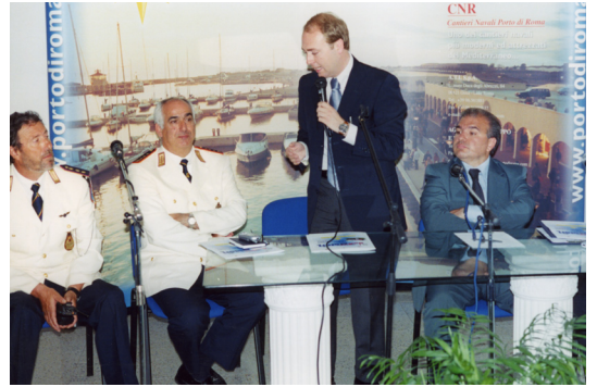
Il Presidente del XIII Municipio con il Comandante VV.UU ed il suo secondo