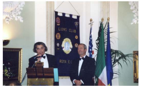
7 Febbraio 2002 - Visita del Governatore