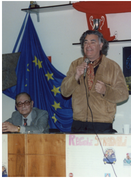
Il Presidente Fabrizio Carmenati

Premiazione al porto di Ostia dei ragazzi vincitori del concorso scolastico sul tema dell'uso del casco